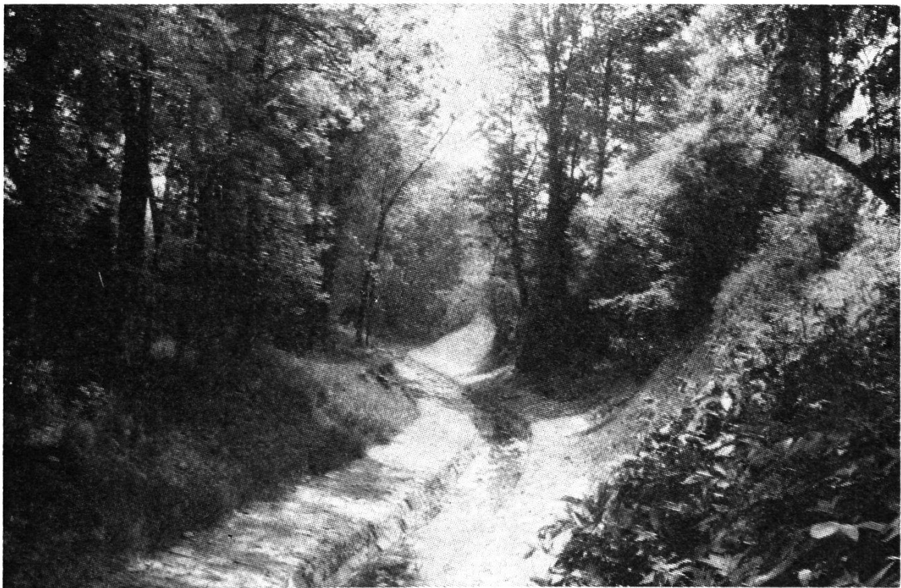
Bild 3: Korrigierter Altstätter Stadtbach, im Zuge der Melioration der Rheinebene. Früher ein unansehnliches Gerinne, eine Abfallgrube – heute ein Musterbeispiel: Natursteinpflasterung unter Schonung des alten Baumbestands.

Sicher gibt es noch zahlreiche weitere gute Beispiele. Es ist bedauerlich, daß Leute, die keinen blassen Schimmer der Regeln von Baukunst, Tiefbau, Erd- und Wasserbau, Statik und Hydraulik haben, sich zu solchen Behauptungen, wie sie unter Punkt 2 erwähnt sind, hinreißen lassen. Leider vergißt der Naturschutz, daß er mit solchen Dingen in weiten Kreisen seine Sympathie verliert. Und das im Naturschutzjahr 1970!