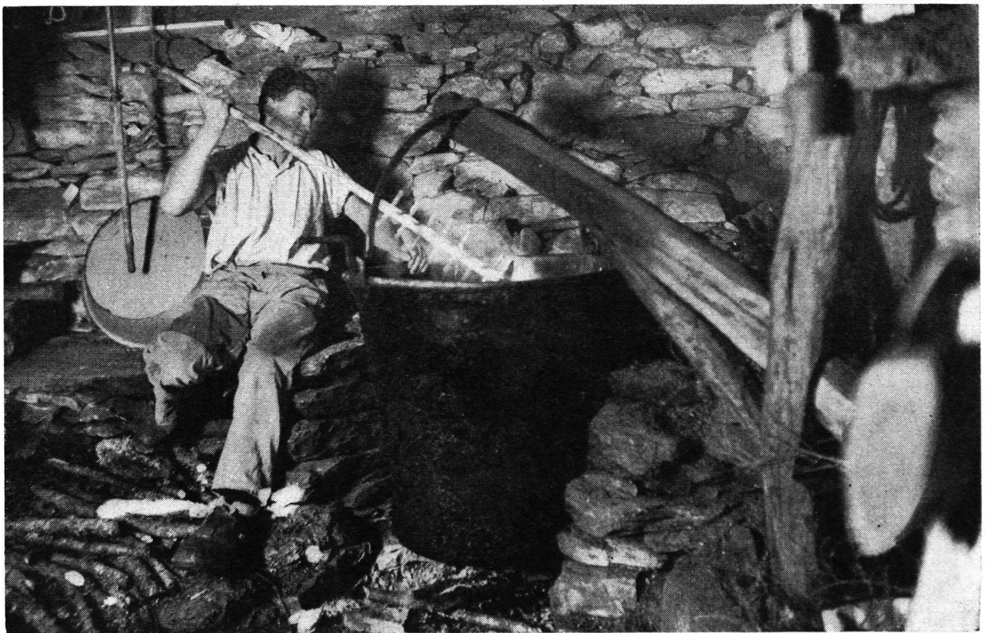
Il casaro al lavoro nella vecchia rudimentale cascina.