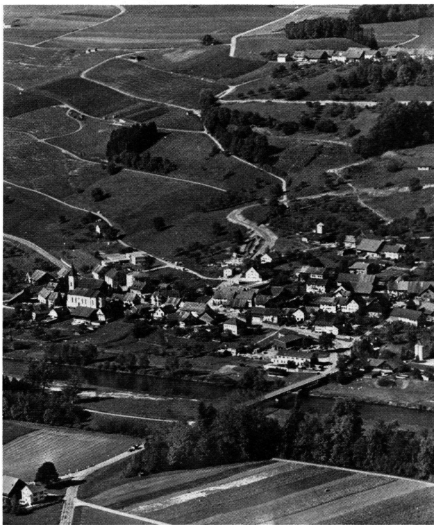
Uesslingen mit dem östlichen Teil des neuen Rebberges, rechts oben Iselisberg

nicht mehr bestimmen. Urkundlich erscheint eine solche erstmals 1169. Ein wichtiges Bauvorhaben wurde 1808 durch Baumeister Kappeler und Inspektor Johannes Sulzberger realisiert, eine gedeckte Holzbrücke über die Thur. 1889 baute man den Flussübergang dann neu aus Eisen und 1933 in Beton.