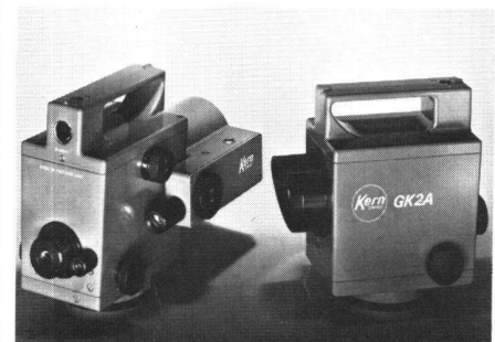
Abb. 1 Kern GK 2-A, neues automatisches Universalnivellier ohne Mikrometer (rechts), mit aufgestecktem Mikrometer (links)

Genauigkeit und Zuverlässigkeit unter allen Bedingungen sind die hervorstechendsten Eigenschaften des GK 2-A. Dafür sorgen ein bewährter Pendelkom-