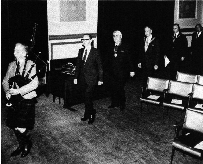
The speakers at the opening-ceremony of the 47th Permanent Committee Meeting

The FIG bulletin will be sent to the Survey Journals of all member countries with the request of translation into the country's language and publication in the text part.