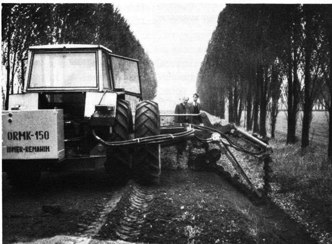
Abb. 2 Grabenreiner bei der Arbeit

Für unterhaltspflichtige Landwirtschaftsbetriebe und -genossenschaften fällt zudem eine einfache Montage- und