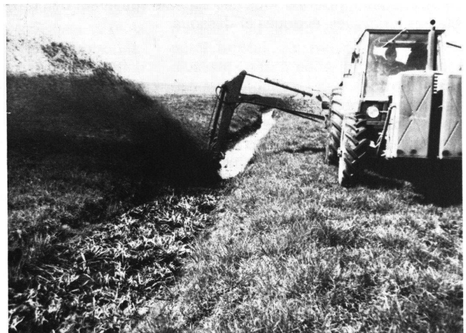
Abb. 3 Sohlenreiner mit Rotor bei der Grabenreinigung