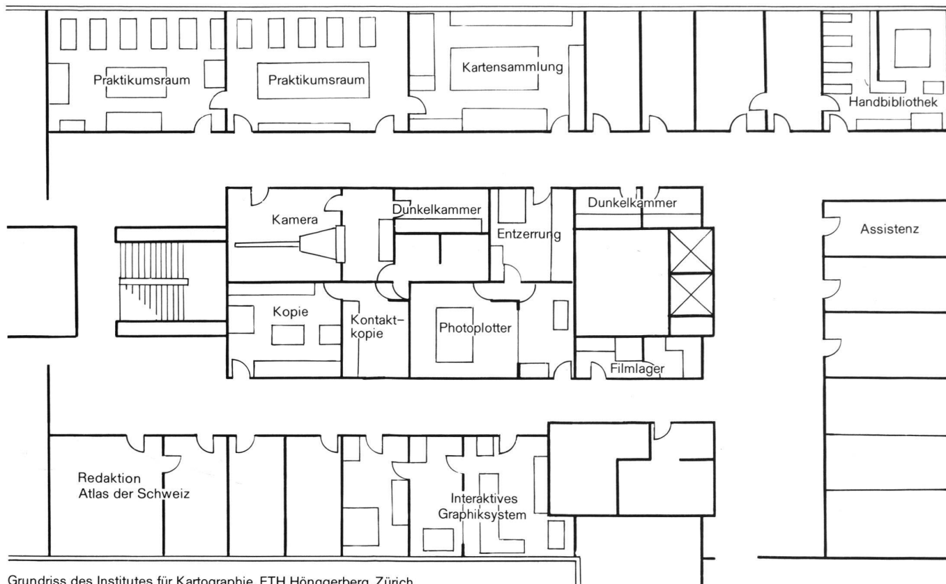
Grundriss des Institutes für Kartographie, ETH Hönggerberg, Zürich.