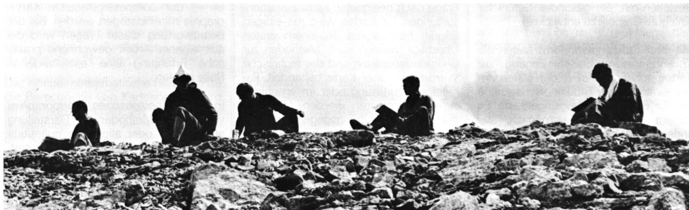
Abb. 2 Topographische Exkursion; Feldzeichnen auf dem Ortsstock