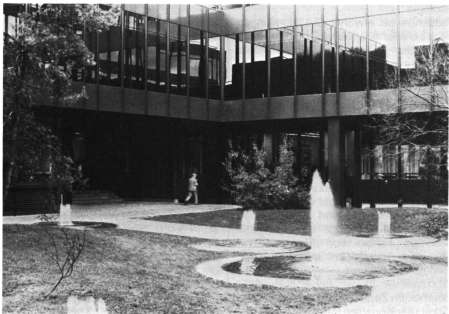
Abb. 1 Lehrgebäude HIL: Innenhof. Im Erdgeschoss rechts das IGP.

Das Institut entschloss sich frühzeitig, nach Studium verschiedener Alternativen, für den jetzigen Standort im Zentrum des Südtraktes des Lehrgebäudes. Es befindet sich hier im Erdgeschoss (D) und im 1. Untergeschoss (C), das