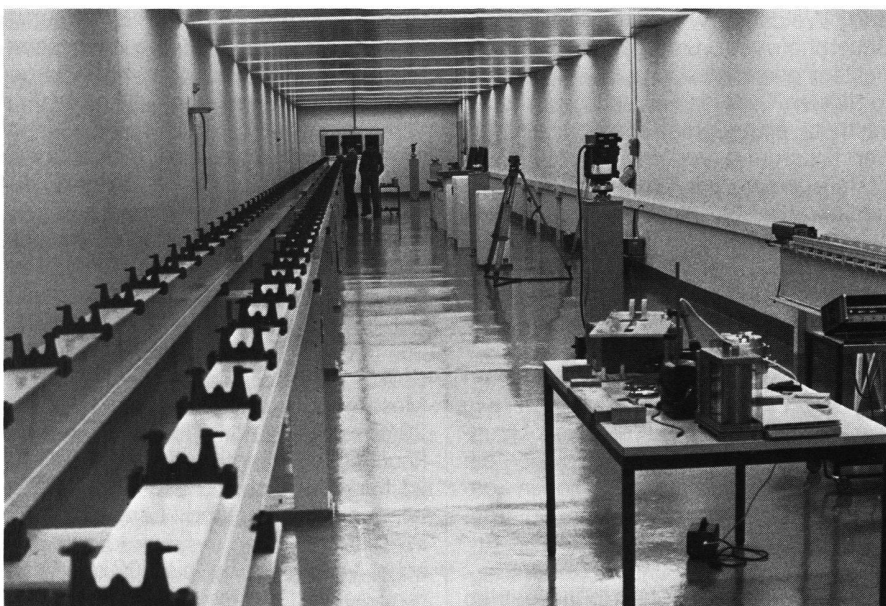
Abb. 3 Messkeller im Ausbau: Links 50 m-Messbahn, hinten Klimakabine, rechts Pfeilerbasis und Latten-Komparator.

Diesem Bereich angeschlossen ist eine kleine Instrumenten-Justierwerkstatt, das Material-Magazin im A-Geschoss,