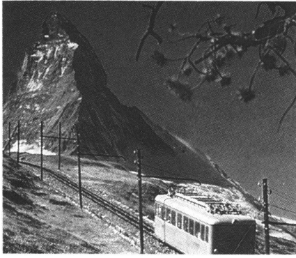
Le cervin (alt. 4477 m) et le chemin de fer du Gornergrat