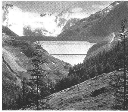
Le barrage de la Grande-Dixence, alt. 2365 m