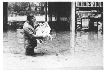
Abb. 2 Überschwemmung von Genfer Wohnquartieren anlässlich der Hochwasser der Seymaz vom 28. Januar 1979.

bestehenden natürlichen Gewässernetz oder Kanalisationsnetz absorbiert werden. Die Systeme werden überlastet und weisen sehr bald eine mangelhafte Funktion auf. Überschwemmungen mit zum Teil sehr kostspieligen oder sogar tragischen Folgen (Abb. 2) sind dann meistens das Resultat. Aber auch unter der Bodenoberfläche können durch Rückstau in Kanalisationen Schäden auftreten, so z. B. an Fundationen.