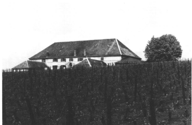
Abb.4 Die Domaine Latour in Aloxe-Corton.