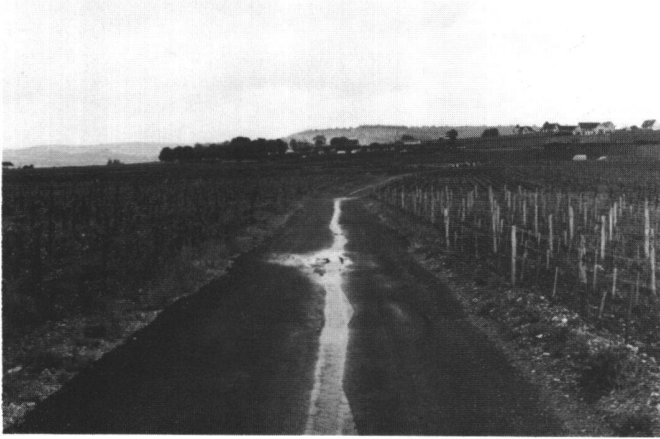
Abb.1 Mit Belag versehener Flurweg, der dank seines V-Profiles auch als Vorfluter dient.