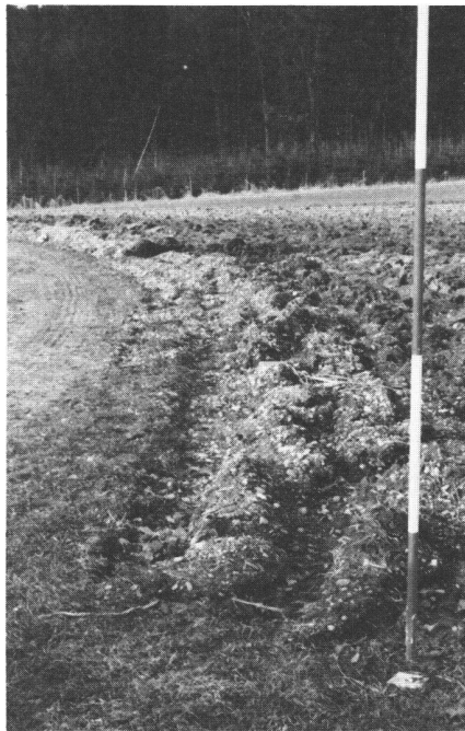
Abb. 5 Solange die Sorgfaltspflicht gegenüber Flurstrassen nicht erfüllt wird, ist jede Vermarkung gefährdet