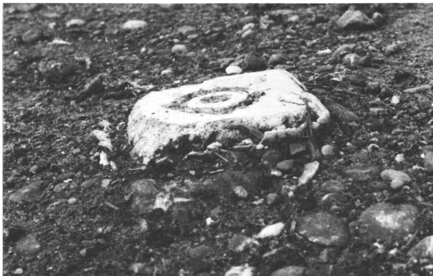
Abb.4 Bei exponierten Marken in Strassen und Plätzen verringert sich die Kopffläche durch stetigen Abrieb