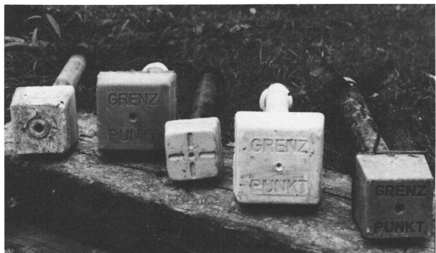
Abb.2 Sortiment der im Kanton Thurgau verwendeten Marken, von links nach rechts: Frings, mit Stahlrohrschaft; Klarer, Vollpolyester; Attenberger, Stahlrohr mit Spindel; Klarer; Frings, Vollpolyester