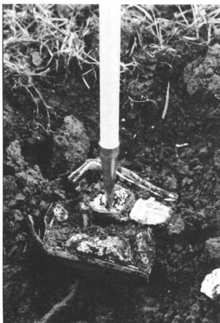
Abb.3 Abgeschlagener Kopf einer Marke mit Stahlrohrschacht