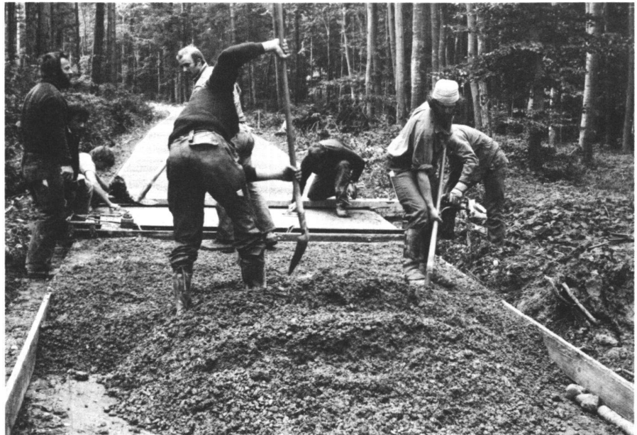
Abb. 5 Die Schüler der Interkantonalen Försterschule in Lyss bildeten beim Betonwegebau in Chabrey (Kanton Waadt) die Arbeitsequipen und stellten abwechslungsweise auch die Bauführung. Sie führten sämtliche Arbeiten, wie erstellen des Planums, stellen der Schalung, verteilen des Frischbetons, bedienen der Doppelrüttelbohle, verdichten und nacharbeiten des Betons, Einbau der Fugendübel und der Fugenstreifen wie auch das Aufrauen mit Besen und Nachbehandeln des Betons, selbst aus. Die Doppelrüttelbohle wird auf der Seitenschalung von zwei Mann langsam über den zu verdichtenden Frischbeton gezogen. Sie verdichtet den Beton in seiner ganzen Stärke von 18 Zentimeter.

Die Schalung (Bretterbreite 1 Zentimeter geringer als Betonstärke) wird auf das vorbereitete Planum gestellt und fixiert. Der Belag folgt dem Profil des Bodens. Das Quergefälle ist zu berücksichtigen, das Längsgefälle folgt den im Forstwegbau üblichen Vorschriften.