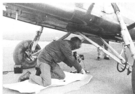
Abb. 1 Aufnahmesituation auf dem Flugplatz Sitterdorf/TG

Für photographische Umbildungen, d. h. Transformationen des gesamten Bildinhaltes unter vorzugebenden Bedingungen, stehen rechnergesteuerte Differential-Entzerrungsgeräte wie der Wild AVIOPLAN OR1 zur Verfügung. Diese Instrumente, ursprünglich nur zur Herstellung von Orthophotos entwickelt, haben sich als überaus flexibel erwiesen. Durch zahlreiche neue Rechenprogramme konnte der Anwendungsbereich der Geräte über photogrammetrische Problemlösungen hinaus beträchtlich erweitert werden. Ein Beispiel hierfür ist die Verwandlung einer geographischen Karte von einer Projektionsart in eine andere, z. B. von flächentreu in winkeltreu [1]. Dabei handelt es sich, wie auch im vorliegenden