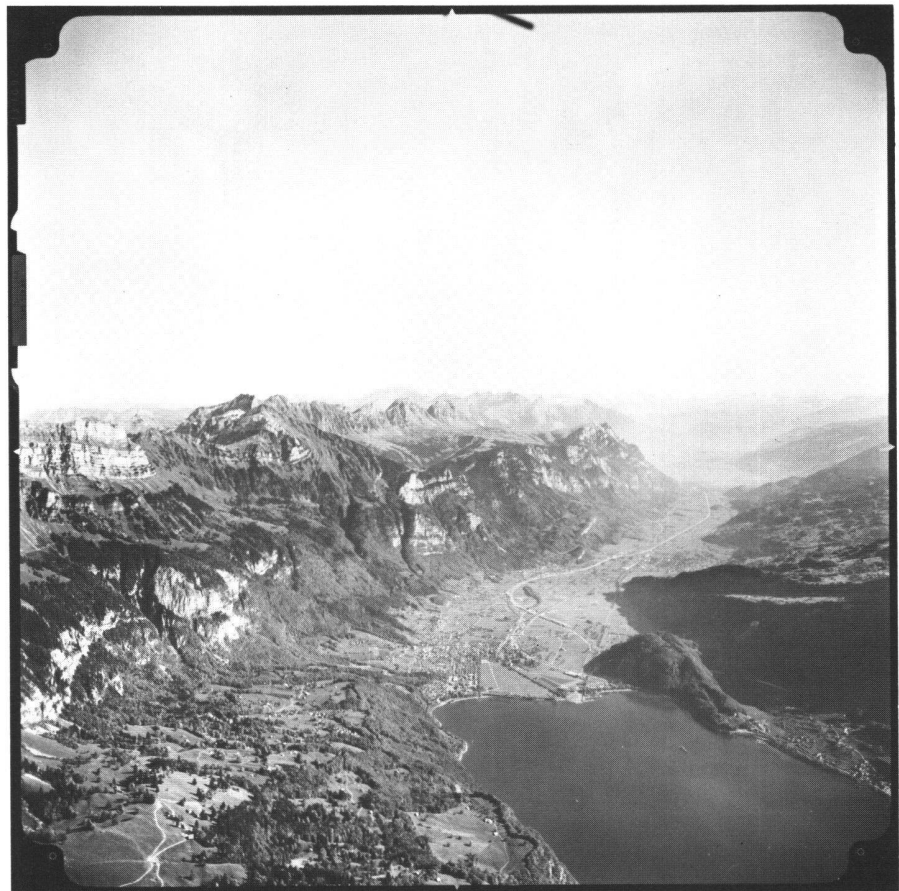
Abb. 3 Schrägaufnahme (B) vom östlichen Walensee, erstellt mit Objektiv 21NAGIIA der RC10A-Kammer