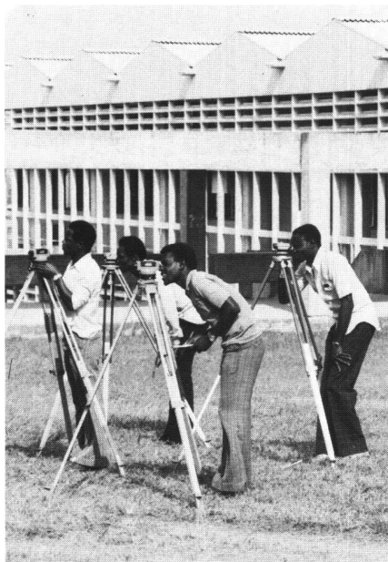
Studenten bei den Einzelprüfungen am Nivelliergerät.

Der Grundkurs Vermessung (Surveying) wird heute während dem zweiten Studienjahr von 60 Bau- und 20 Landwirtschaftsingenieurstudenten besucht. Für den Unterricht und die praktischen Feldübungen stehen innerhalb von 28 Wochen etwas mehr als hundert Stunden zur Verfügung,