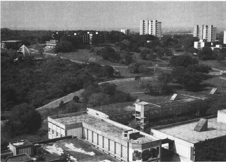
Allgemeine Ansicht der Universität mit Kirche, Moschee und Studentenunterkünften.