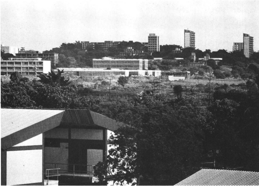
Allgemeine Ansicht der Universität von Dar es Salaam mit Ingenieurfacultät und Studentenunterkünften.

in der Politik, in den Primarschulen, in den Massenmedien und vor allem im täglichen Leben. An der Universität erfolgt der Unterricht aber in Englisch, und es ist nicht beabsichtigt, dies zu ändern. Besonders in den Ingenieurwissenschaften wäre Kiswahili als Unterrichtssprache sehr problematisch, da der technische Wortschatz ungenügend ist, keine technischen Bücher in Kiswahili vorhanden sind und nur wenige ausländische Dozenten diese Sprache genügend beherrschen.