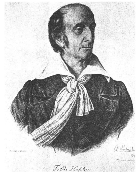
Abb. 1: F.R. Hassler 1770 – 1843.

und das Amt für Mass und Gewichte. Man hofft dieses Projekt, das etwa 5000 Dollar kosten wird, vor dem 14. Todestag von Hassler am 20. November 1987 abschliessen zu können. Es ist auch vorgesehen, eine Denkschrift herauszugeben. Die American Philosophical Society hat sich als Sammelstelle für Spenden bereit erklärt. Steuerabzugfähige Spenden an den Hassler-Fonds können an ihre Adresse: 104, South Fifth Street, Philadelphia, PA 19106-3387, überwiesen werden. Für weitere Information wende man sich an Capt. Charles Bourroughs, 686 College Parkway, Rockville, MD 20 850.