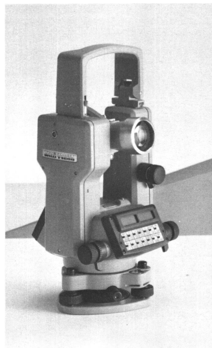
Abb. 1: Der Theomat Wild T1600 ist ein perfekter elektronischer Theodolit hoher Winkelmessgenauigkeit.

Ihr neuestes Theomat-Modell, den Wild T1600, stellen die Schweizer Instrumentenbauer vor. Es ist, das zeigt schon ein erster Blick auf die technischen Daten der Produkt-