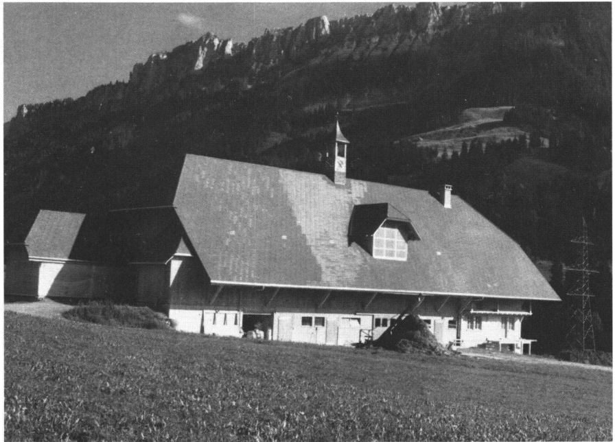
Abb. 2: Berücksichtigung des Heimat- und Landschaftsschutzes im Hochbau: Der nach einem Brand im traditionellen Baustil der Gegend vollständig wiederaufgebaute «Cheerlishof» in Bumbach, Gemeinde Schangnau/BE. Im Hintergrund der Hohgant.

Als Folge des Leitbildes und der neuen Gesetzgebung haben wir uns besonders im Hochbausektor seit 1980 weitgehend von der Beitragspraxis des Bundes gelöst.