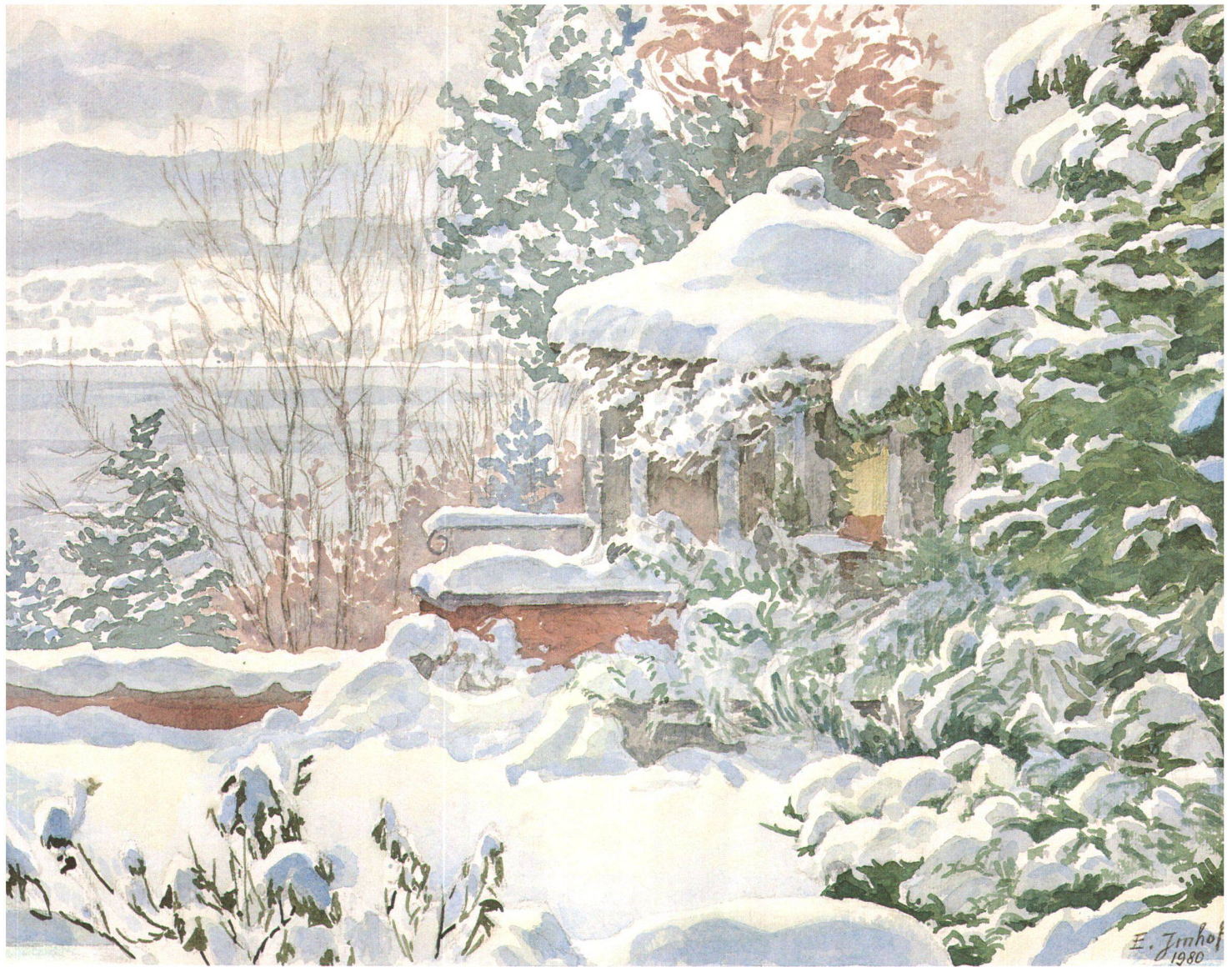
Bild 28: Eduard Imhof, Mein Gartenhäuschen im Winter. Aquarell 1980. 33/44 cm.