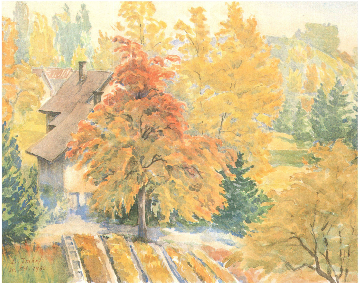
Bild 27: Eduard Imhof, Des Nachbarn Gärtnerei im Herbst. Aquarell, 30. Oktober 1980. 35/47 cm.

kannt. Als Verfasser zahlreicher Fachbücher sowie als Chefredaktor des Atlas der Schweiz erwarb er sich bleibende Verdienste. Trotz seines internationalen Rufes und der damit verbundenen grossen Beanspruchung ist er mit unserem Dorf wie auch mit seiner Bevölkerung eng verbunden geblieben und nimmt aktiv am Geschehen in unserer Gemeinde teil.»