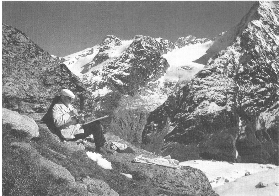
1965, Eduard Imhof malt auf der Fuorcla Surley.

Auftrag des Schweizerischen Bundesrates zur Bearbeitung des «Atlas der Schweiz». Ernennung zum Präsidenten der Redaktionskommission und zum Chef-