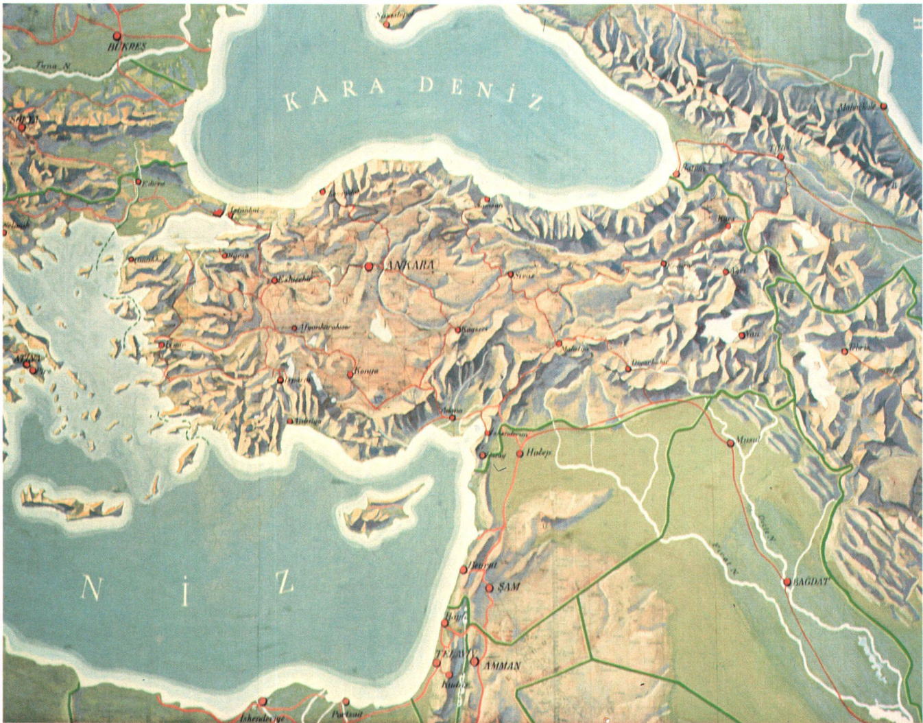
Bild 24: Eduard Imhof, Karte der Türkei 1:2 000 000. Ausschnitt, hier verkleinert auf etwa 1:12 000 000. Temperagemälde 1951. Diese Karte, deren Original vielleicht heute noch in einem Ministerium in Ankara hängt, malte Eduard Imhof zusammen mit seinen türkischen Studenten anlässlich seines Aufenthaltes als Lehrer am türkischen Landesvermessungsamt. Es ist die erste Imhof-Karte, die die später auch im Mittelschulatlàs für kleinmassstäbige Karten angewandte Farbskala zeigt.