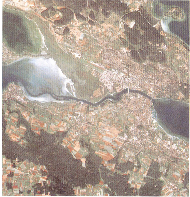
▲ Abb. 2: Region Kreuzlingen-Konstanz: a) Landsat-TM (2.9.84), Normalfarbenkombination b) Landsat/SPOT-Kombination