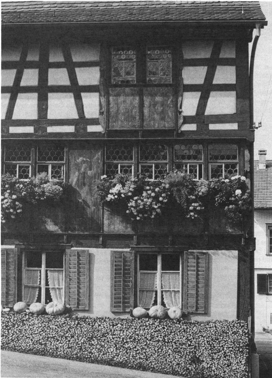
Abb. 2: Ermatingen – Handwerkskunst am 1694 erbauten Haus zum «Kehlhof». Keller(hof) (lat. cella); Ort, an dem die Naturalien der zehntenpflichtigen Bauern eingelagert wurden.

stab von St. Gallen erreichte es, dass König Otto I. den Hafentort Rorschach 947 zu einem Marktstädtchen erhob, wobei der Verkehr nach Italien ausdrücklich erwähnt wurde. Hier wechselte wohl der Verkehr vom See- zum Landweg.