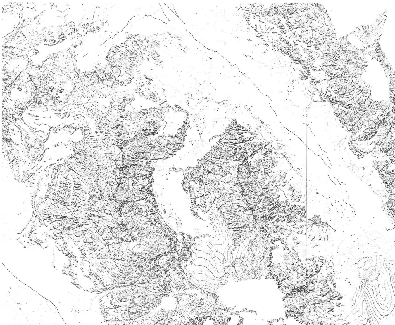
Abb. 3: Topographische Karte 1:25 000 «Panta» in der Cordillera Vilcabamba, Peru. Aufgenommen anlässlich der Andenexpedition 1959 des Schweizer Alpen-Club nach dem Verfahren der terrestrischen Photogrammetrie im Juni und Juli 1959. Aufnahme, Gesamtedaktion der Karte und Gravur der Felsgebiete und Eisbrüche durch Ernst Spiess. Die Abbildung zeigt einen Ausschnitt aus der Felsgravur im zentralen Kartenteil.

Ein Ausschnitt des greifbaren Erlebnisses dieser Expedition liegt dieser Festschrift bei: ein Ausschnitt Deiner Karte der Panta-Gruppe 1:50 000, für die Du das zu kartierende Gebiet festgelegt, im Alleingang in wochenlanger Arbeit über 50 Haupt- und Passpunkte und 28 Basislinien zwischen 4200 und 4830 m über Meer eingemessen und 360 Photoplatten mit einem Wild Phototheodo-