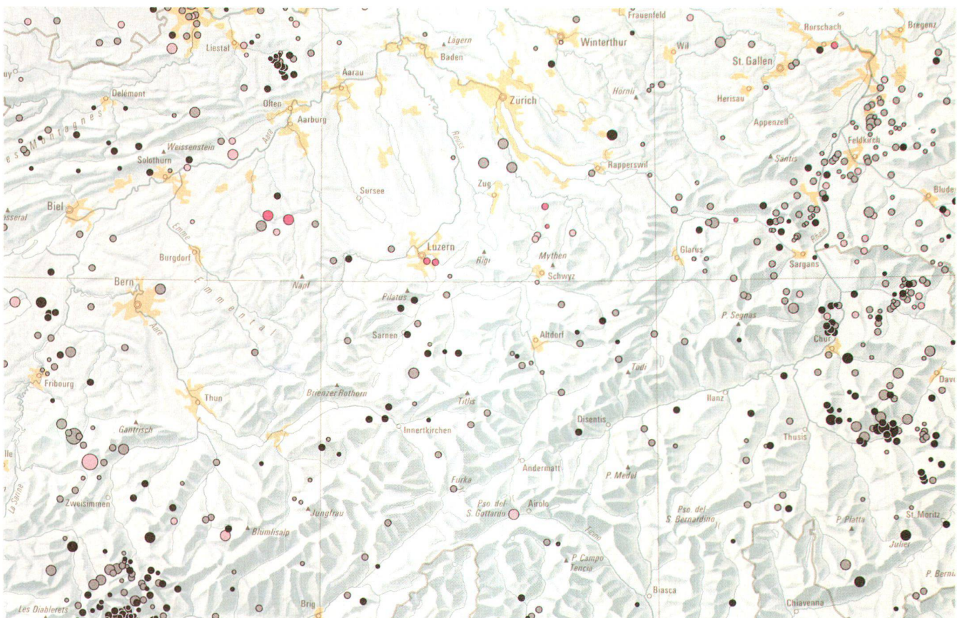
Fig. 2: Atlas de la Suisse, fragment de la feuille 10b, «Gravité, sismicité, géothermie», 2e édition 1984. Rédaction et élaboration cartographique: Institut de cartographie EPFZ. © 1984, Office fédéral de topographie, CH-3084 Wabern.