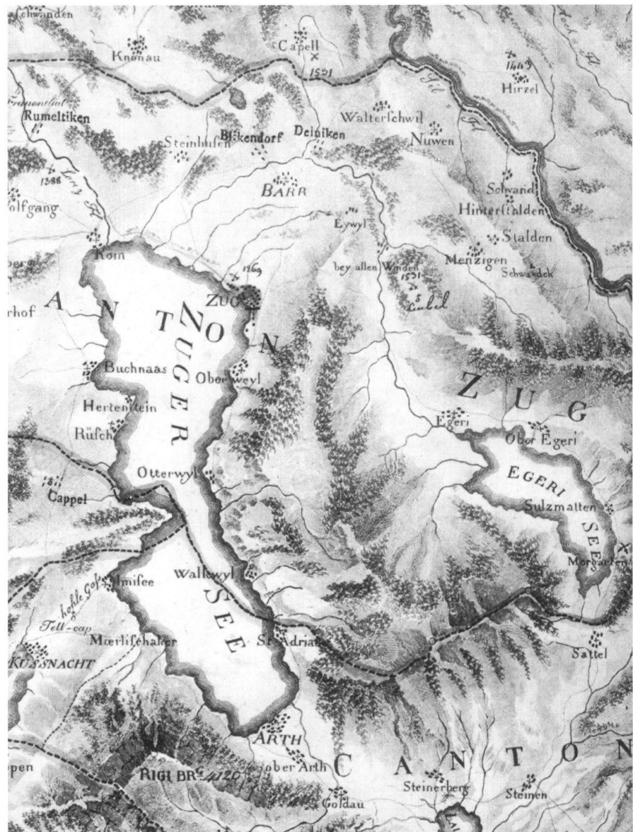
Ausschnitt Atlas de la Suisse, Meyer/Weiss, 1796/1802.

Auskünfte: Im Schössli, Schlossplatz 23, CH-5000 Aarau, Telefon 062 / 836 05 17.