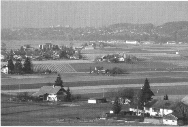
Abb. 1: Zersiedelter Siedlungsrand im Mittelland.