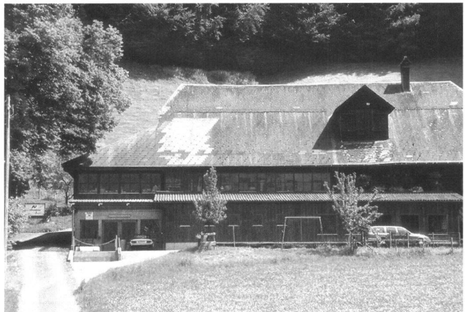
Abb. 6: Schreinerei als Annexbetrieb im Bauernhaus.

bereits solche Aufstockungen zulässt. Man sieht solche Masthallen und Glashauskulturen denn auch überall (Abb. 3). Beim Vorschlag des Bundesrates geht es also um grössere, bzw. rein bodenunabhängige Betriebe (Abb. 4).