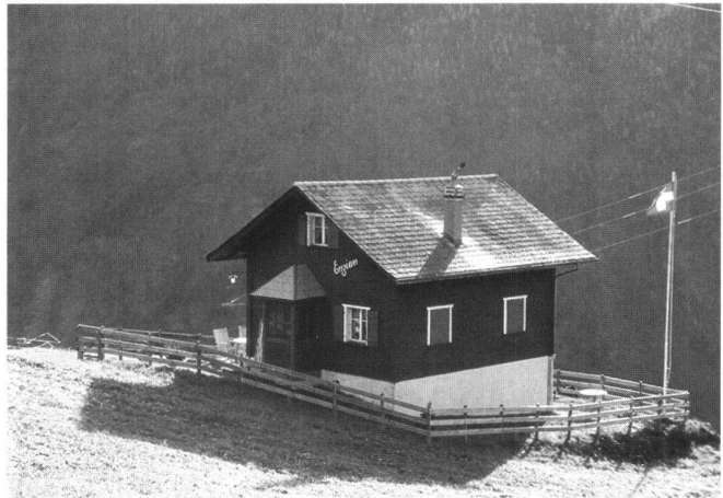
Abb. 8 und 9: Wovon man träumt und was der RPG-Entwurf zulässt... Schliesslich die Frage: wann entwickelt sich das Zulässige zum Erträumten – und das ohne Baubewilligung? (© VLP)

Voraussetzungen des Abs. 4 erfüllt sind. Klar ist auch, dass es nach der Umnutzung keine zweite Erweiterung mehr gibt (im Sinne einer weiteren teilweisen Änderung): dies wäre mit den Voraussetzungen gemäss Abs. 4 nicht vereinbar.