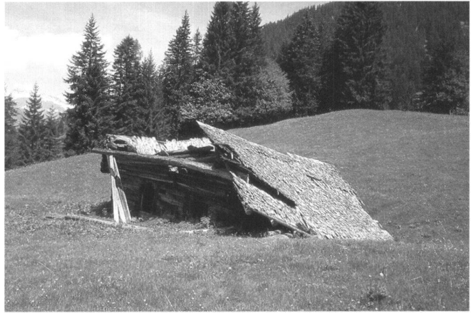
Abb. 2: Verfallenes Ökonomiegebäude.