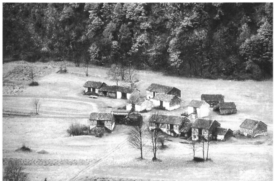
Abb. 7: Jede Häusergruppe eine Ferienhaussiedlung?

Die Botschaft des Bundesrates hält das Potential in diesem Bereich nicht für gross (Botschaft 208.3). Dazu sei ein Fragezeichen erlaubt; denn es handelt sich hier offensichtlich um den «Rustici-Artikel». Von dieser Art Gebäude gibt es zehntausende in der ganzen Schweiz. Dazu kommt, dass die Gewinnmöglichkeiten hier am grössten sind: Aus einem Ökonomiegebäude kann ich ein Ferienhaus machen. Seien wir uns bewusst: Es geht nicht um den – oft noch tolerierbaren – Einzelfall, sondern um eine allgemeine Regel, die für jedermann gilt, der auch gerne ein Ferienhäuschen im Grünen hätte.