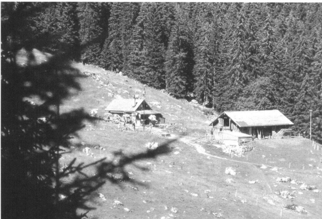
Abb. 5: Ausflugsrestaurant im Alpbetrieb.