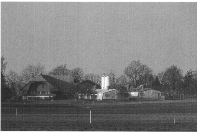
Abb. 3: «Aufgestockter» Bauernbetrieb.