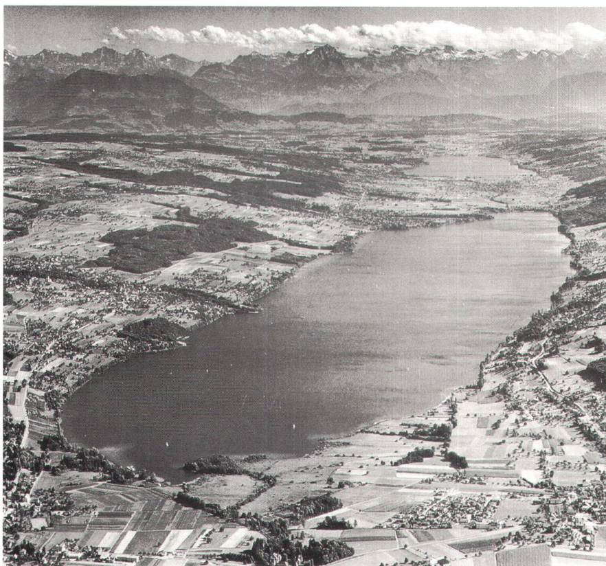
Abb. 2: Hallwiler- und Baldeggersee.

Sediment. In der Folge wird im Sediment bis zu 20% mehr Algenmaterial von Kleinlebewesen abgebaut.