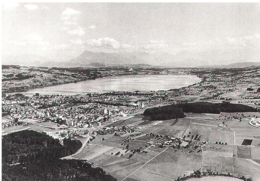
Abb. 1: Sempachersee.

Nach der Ausschreibung eines Ingenieur-Ideenwettbewerbes wurde in den drei Seen die Zirkulationshilfe und der Sauerstoffeintrag ins Tiefenwasser eingerichtet. Neben dieser Symptombekämpfungsmassnahme wurden weitere verursacherbezogene Massnahmen ergriffen: