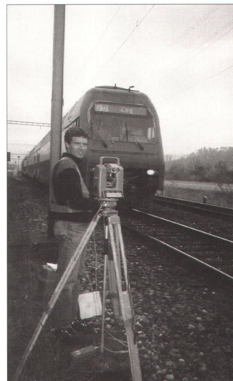
Abb. 1: Vermessungsarbeiten erfordern höchste Präzision und Genauigkeitsnachweise. Unsere Arbeitsabläufe konnten dank QM verbessert und optimiert werden.

Wir sind uns in der Vermessung seit jeher