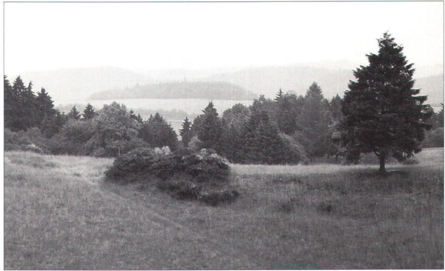
Abb. 1: Typische Eifellandschaft: Hügel und scharfe Vegetationsgrenzen. Vulkankraterhang: Wiese, jenseits des Kraterrandes: Waldbestand (Papenkaule).

Als Pilotprojekt wurde das Gebiet der Verbandsgemeinde Hillesheim gewählt, die aus elf selbständigen Ortsgemeinden mit 24 Dörfern und Weilern besteht (130 km 2 ). In diesem Gebiet sind die unterschiedlichen geologischen Baueinheiten der Eifel sichtbar: über einem gefalteten Grundgebirge aus dem Devon lagert flach ein Deckgebirge aus Buntsandstein, das von jungen vulkanischen Gesteinsschichten überlagert und durchschlagen wird. 1988 wurde durch Zusammenarbeit der Gemeinden und der Wissenschaftler der erste Teilabschnitt eines Lehr- und Wanderpfades rund um Hillesheim eröffnet.