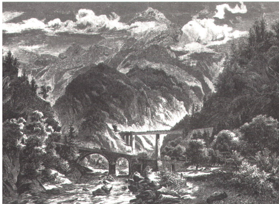
Abb. 1: Der grosse Viadukt über den Eingang in das Maderaner-Thal bei Amsteg. Illustrierte Zeitung Leipzig vom 18. März 1882, S. 209 (Bild Zentralbibliothek Zürich).

Das Bezugsquellen- Verzeichnis gibt Ihnen auf alle diese Fragen Antwort.