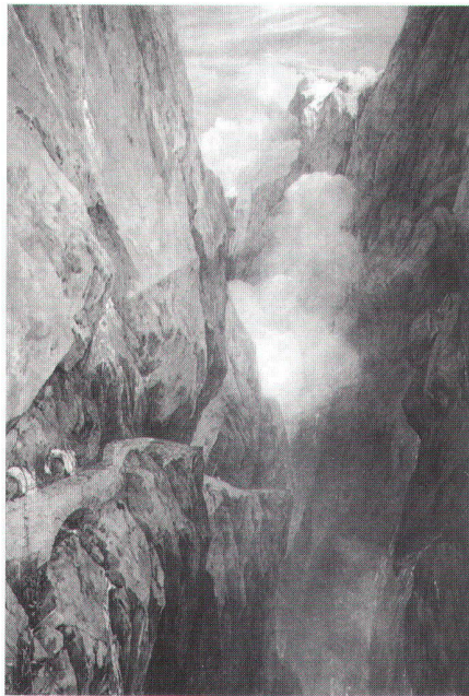
Abb.1: Der Pass über den St. Gotthard von der Teufelsbrücke aus (1804).

Eine besondere Vorliebe hatte Turner für die Schweiz. Von seiner ersten Reise in die Schweizer Alpen 1802 zurückgekehrt, schuf Turner in London eine Reihe grossformatiger Aquarelle nach Skizzen im sogenannten «St. Gotthard- und Mont-Blanc-Skizzenbuch». Turner veranschaulicht die Monumentalität, die Öde und das «Erhabene» der alpinen Bergwelt. Die Teufelsbrücke diente zahlreichen Aquarellen als Motiv. Auch später war Turner wiederholt in der Schweiz: 1841–1844 verbrachte er den Sommer jeweils in der Schweiz, vor allem in