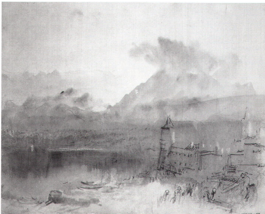
Abb. 2: Luzern mit dem Pilatus (1844).

Genf, Lausanne, Zürich und Luzern. Motive wie die Savoyer Berge, der Vierwaldstättersee, Rigi und Pilatus entstanden oft an den Fenstern seiner Lieblingshotels. Dabei entstanden zahlreiche Serien der gleichen Landschaft zu verschiedenen Tageszeiten und bei unterschiedlichem Wetter. In diesen Arbeiten erreichte Turner mit Licht, Wolken, Nebel und