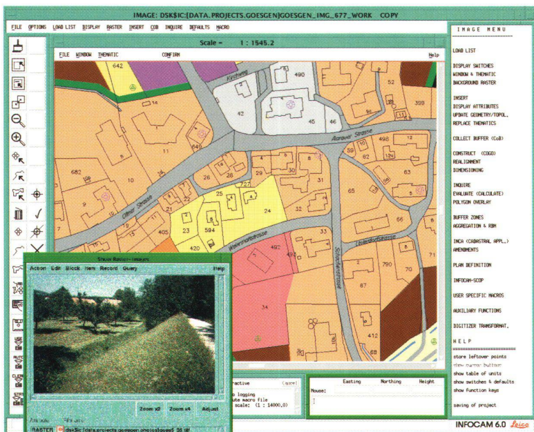
Abb 1: INFOCAM: Leistungsfähige Analysefunktionen erleichtern Ihre Arbeit.

Dieses Softwarepaket bringt Ihnen die Leistungsfähigkeit umfassender Systeme auf Ihren PC. Mit Cadmap/Magellano erfassen und verwalten Sie alle Medien einer Gemeinde effizient. Cadmap/Magellano ist modulförmig aufgebaut und ist somit jederzeit den Gegebenheiten anpassbar. Zur Zeit sind die Module Wasser, Abwasser und Elektrizität erhältlich. Alle anderen Medien wie Gas, TV, Telefon können in graphischer Form verwaltet werden. Der Datenaustausch zu anderen Systemen wird mit verschiedenen Schnittstellen sichergestellt. Der Datenimport und Export kann auch im AVS Format erfolgen. Die Abfrage und Analysesoftware ArcView greift direkt auf die Datenbestände von Cadmap/Magellano und eignet sich somit hervorragend als kostengünstige Abfragestation.