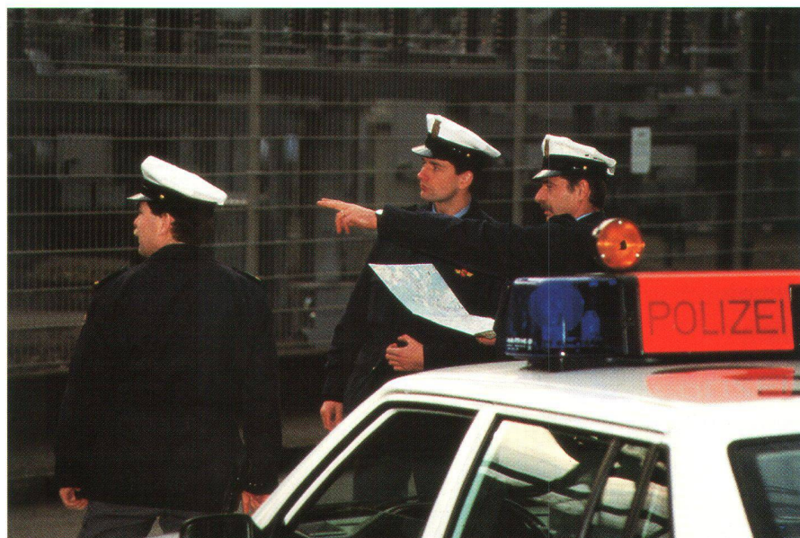
Abb. 1: NovaTrack: Element eines Einsatzleitsystems oder Flottenmanagements.

Wir ermöglichen Ihnen die geographische Verknüpfung Ihrer bestehenden Datenbanken und die Erfassung und Pflege von zusätzlichen Daten über spezielle Eingabemaschinen. Die Daten dieser Einzelplatz- oder Client/Server-Lösungen werden je nach Datenvolumen in Access oder Oracle gehalten.