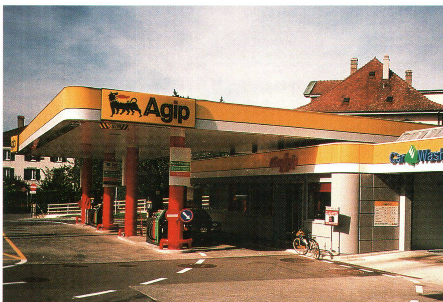
Fig. 3: AGIP gère son réseau de stations-services avec une application Novasys. Abb. 3: AGIP verwaltet und steuert Ihre Tankstellen mit einer Lösung von Novasys.

MapInfo est le leader mondial dans les solutions de Business Mapping et dispose