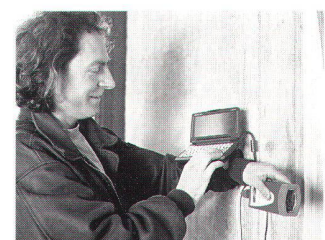
Fig. 2: DISTO memo et palm-top: pour un maximum de confort dans le travail.

En mesure, on doit parfois faire face à de grandes quantités de données. Afin de les traiter rationnellement, le lasermetre portable DISTO memo dispose d'une interface RS 232, qui permet d'échanger des données avec des ordinateurs, des portables ou Newton. Pour le transfert des données vers l'ordinateur, on dispose d'un programme d'interface EXCEL 97