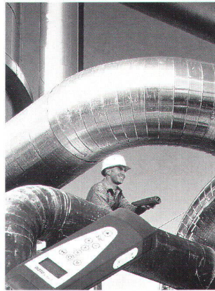
Fig. 1: Lasermètre portable DISTO memo: l'instrument de mesure intelligent, rapide et précis.

Mesure intelligente avec le nouveau lasermetre portable DISTO