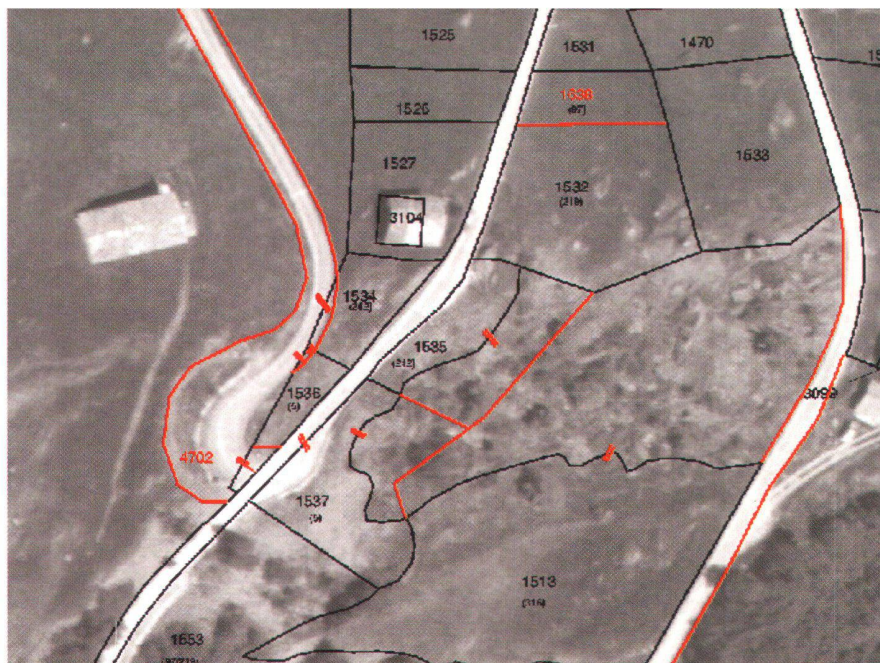
Abb. 3: Orthophoto mit Parzellarvermessung-Grenzbereinigung (Parzellengrenzen gemäss Blitzaktion-Vermessung 1979 in Schwarz, neue bereinigte Grenze in Rot, # aufzuhebende Grenze).