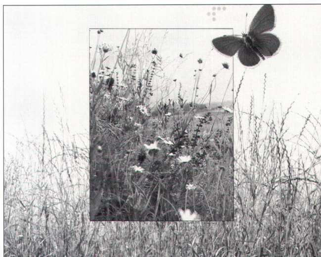
Abb. 3: Aufgrund der Bonusbeiträge für besondere Artenvielfalt werden extensive Heumatten im Kanton Solothurn auch tatsächlich so genutzt, dass sie eine reichhaltige Flora und Fauna aufweisen.