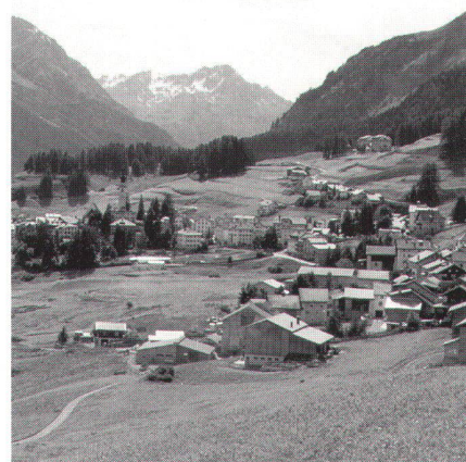
Abb. 5: Ftan.