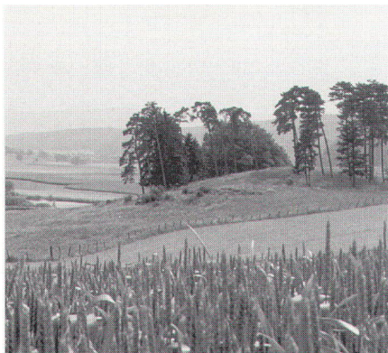
Abb. 3: Dampfreux.

de in der Ajoie, rund 7 km nördlich von Pruntrut, wird auf einer Fläche von 397 ha eine Melioration durchgeführt. Zum Schutz der ökologisch wertvollen Moore in der Umgebung des Juradorfes hat sich, unter Beteiligung von Umweltorganisationen, Kanton und Gemeinde, die «Fondation des Marais de Dampfreux» gebildet. Diese Stiftung hat landwirtschaftliche Flächen aufgekauft und möchte diese nun im Rahmen des Landumlegungsverfahrens im Bereich der naturschützerisch wertvollsten Gebiete arrondieren. Es ist geplant, die Moorflächen in der Ortsplanungsrevision als Schutzgebiete auszuweisen und den ansässigen Landwirten zur extensiven Bewirtschaftung zu verpachten. Eine offene Streitfrage zwischen der Trägerschaft und den beteiligten Umweltorganisationen bildet die Höhe des Tauschwertes, der den Moorflächen bei der Neuzuteilung zuzuweisen ist.