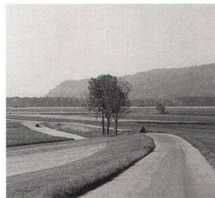
Abb. 2: LEU T10.

liorationsverfahren ökologische Aufwertungen realisieren lassen. Für den Bau der Umfahrungsstrasse, welche die Dörfer Gals, Gampelen, Ins und Müntschemier vom Durchgangsverkehr auf der Kantonsstrasse T10 zwischen Bern und Neuenburg entlasten soll, werden grosse Flächen im mehrheitlich privat bewirtschafteten Landwirtschaftsgebiet beansprucht. Die Landumlegung erlaubt es, die berechtigten Anliegen der Grundeigentümer zu berücksichtigen und gleichzeitig die für das neue Trasse und den ökologischen Ersatz und Ausgleich benötigten Flächen sicherzustellen, ohne auf das radikale Mittel der Enteignung zurückgreifen zu müssen. In einer intensiven Auseinandersetzung zwischen Landwirtschaft, Projektbeauftragten und Bauherrschaft (Kanton Bern) sind Umfang und Lage der Massnahmen zugunsten der Ökologie ausgehandelt worden.