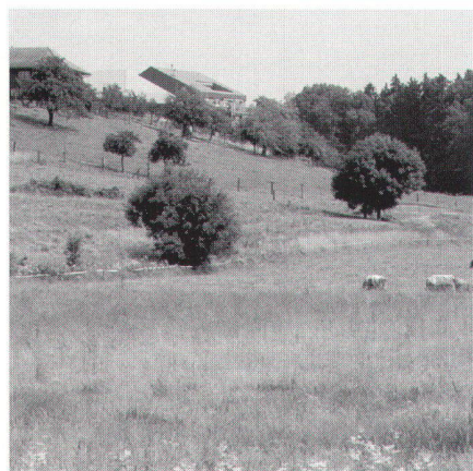
Abb. 4: Greifensee.

Greifensee dient als Beispiel für eine Melioration in einem dichtbesiedelten, von Nutzungskonkurrenz geprägten Agglomerationsraum. Durch die Nähe zur Stadt Zürich kommt dem Gebiet um den Greifensee eine wichtige Funktion als Naherholungsgebiet zu. Neben den landwirtschaftlichen Zielen erhalten damit die