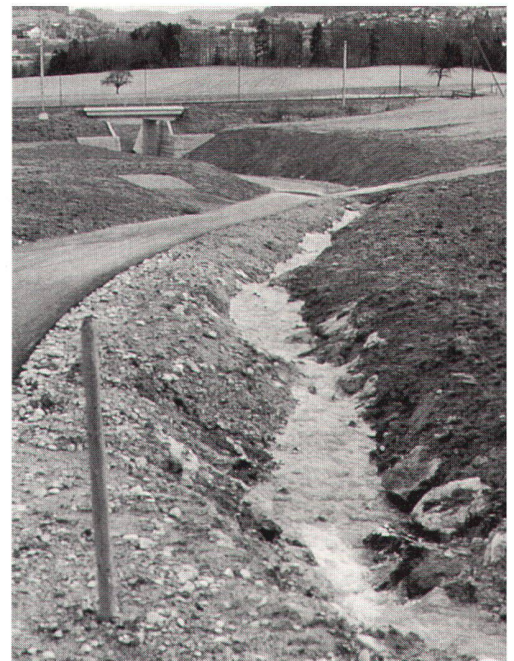
SBB-Unterführung mit neu geschaffenem Bach Aespis.

Es fand ein Wandel in den Köpfen statt. Denn die meisten Akteure sind seit über zwanzig Jahren dieselben. Dieselben, die noch vor zehn Jahren heftig und in aller Öffentlichkeit aneinander geraten waren, sind aufeinander zugegangen. Das ist bemerkenswert und stimmt besonders freudig. Natürlich brauchte es zunächst den Druck verbesserter Naturschutz-