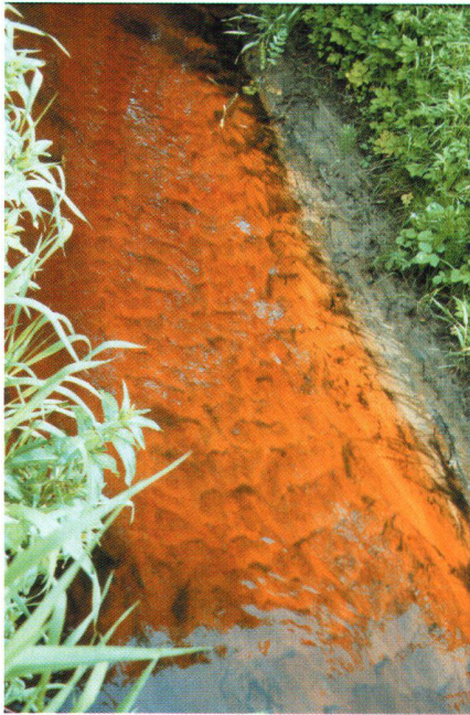
Abb. 2: Wie verhält sich die bewegliche Sohle – das Interstitial?