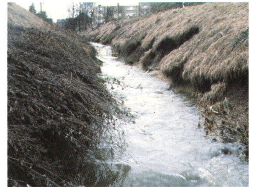
Abb. 1: Wieviel Erde braucht/nimmt sich ein Bach?

währt oder ihm in «Bodenhaltung» einen gewissen Spielraum lässt». Gleichzeitig muss der Ingenieur jedoch weiterhin wissen, wie er ein Gewässer bändige, wenn es die Menschheit in «Käfighaltung» gesichert wissen will oder es gar als Bachleiche unter den Boden verbannt; denn das Recht des Menschen weist dem Bach den Raum. Dieses Recht der Menschen ändert sich mit diesen nach Raum und Zeit. Wie immer auch das Recht lautet, eine heutige Beantwortung der aufgeworfenen Fragen kann einerseits nur auf der Grundlage eines erweiterten Wissens über die Fliess-, Ausbreitungs- und Transportvorgänge in den Gewässern, über die Wechselwirkung der Gewässer mit ihrem Bett, ihren Ufern und den anliegenden Auen, über die Prägung eines Gewässers durch sein Einzugsgebiet und über die darin ausgeübten, flächendeckenden land- und forstwirtschaftlichen Einwirkungen (auf Gedeih oder Verderb der Umwelt) erfolgen. Andererseits muss die Fülle dieses Wissens durch geschickte Handhabung von Methoden zu den richtigen Entscheiden und daraus zu den konkreten Handlungsanweisungen für die Realisierung führen.