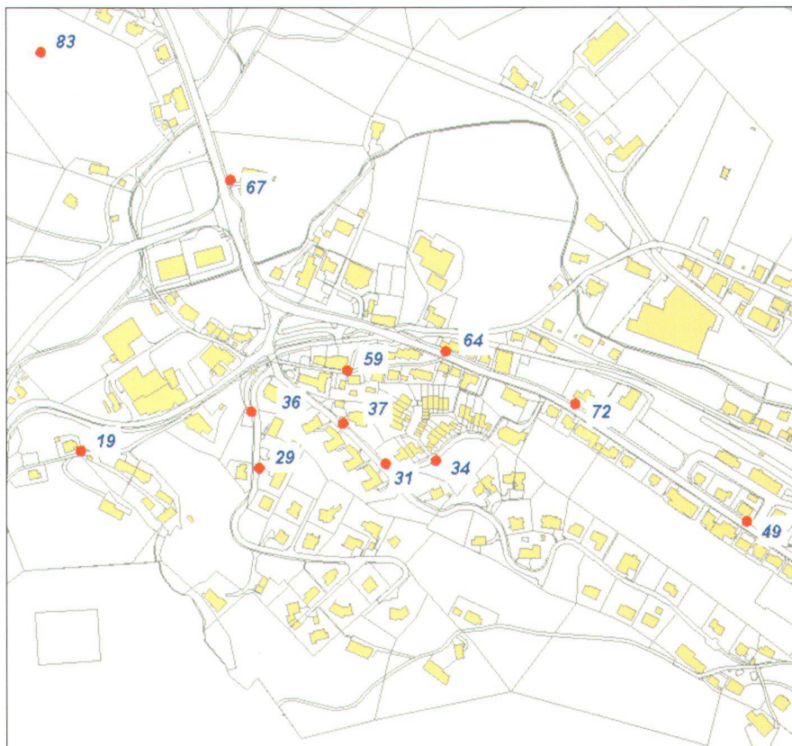
Abb. 1: LFP3 ohne Höhe mit Höhenzuverlässigkeit JA.

Export durchgeführt werden. GRIPSmedia verwendet ebenfalls die Text Pipes von GEOS Pro. Die Funktionen von ProCalc stehen auch für GRIPSmedia vollumfänglich zur Verfügung.