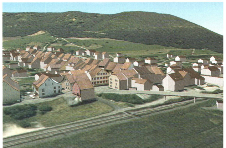
Abb. 2: 3D-Landschaftsmodell (Gemeinde Itingen BL) – generiert und verwaltet mit DILAS.