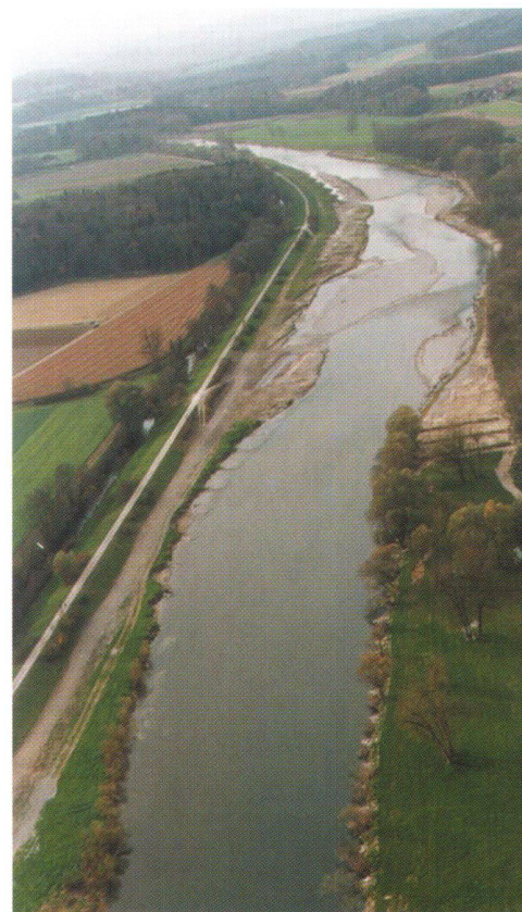
Abb. 2: Wie weit lassen sich die ökologischen Funktionen der Landschaft mit Revitalisierungen wieder herstellen? Entspricht die ökologische Sanierung auch den Bedürfnissen der Bevölkerung?

Das anhaltende Wachstum der Ballungsräume führt zur Frage, wie das Städtesystem der Schweiz in Zukunft aussehen wird. Werden sich kleinere Städte als regionale Zentren behaupten können, oder wird die Dominanz der Metropolitanregionen weiter zunehmen? Ein Projekt entwickelt daher verschiedene Szenarien, die hinsichtlich Flächenverbrauch sowie der wirtschaftlichen und gesellschaftlichen Wünschbarkeit beurteilt werden [8]. Ein