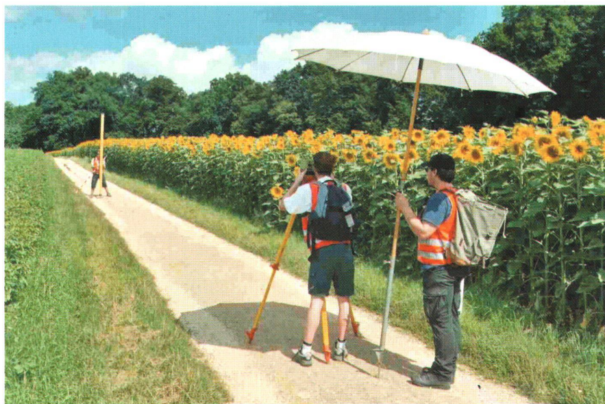
Abb. 1: Klasse G2: Präzisionsnivellement im Deformationsnetz Margelacker/Muttenz.

Im ersten Halbjahr 2001 wurden alle FH-Studiengänge nach einem vom Bundesamt für Berufsbildung und Technologie (BBT) vorgegebenen Raster durch vom BBT eingesetzte Peer-Gruppen evaluiert (vergleiche Jahresbericht 2001, VPK 3/2001). Im Juli 2002 wurden die Studiengänge offiziell vom BBT über die Resultate dieser wissenschaftlichen Überprüfung informiert. Der Studiengang Geomatik der