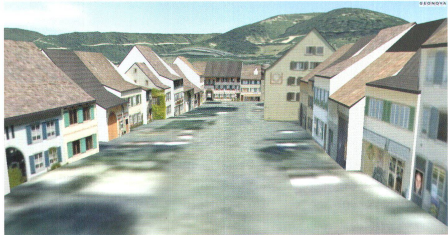
Abb. 2: 3D-Modell Dorfkern Itingen/BL (Ausschnitt). Studienarbeit der Klasse G6 im Sommersemester 2002.

Das Swiss Virtual Campus Projekt «GITTA» (Geographic Information Technology Training Alliance) mit aktiver Beteiligung der Abt. Vermessung und Geoinformation der FHBB und acht weiterer Hochschulinstiute aus der ganzen Schweiz wurde im Juli 2001 gestartet. Das Projekt hat zum Ziel, eine webbasierte Lernplattform zum Thema Geographische Informationswissenschaften zu schaffen und