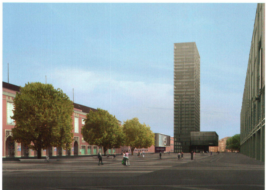
Abb. 1: Modell des Messeturms.

Für das Hinaufziehen der Stockwerke wurde die sonst übliche Absteckungsmethode mit Freien Stationierungen auf dem Arbeitsstockwerk mit Orientierung an aussengelegenen Fixpunkten wegen des Schwingungseinflusses und des für diese Arbeiten äusserst knappen Zeitfensters verworfen. Als weiteres entscheidendes Erschwernis für diese Methode kam hinzu, dass auf dem Arbeitsstockwerk das Fassadengerüst die Sicht nach aussen verunmöglichte.