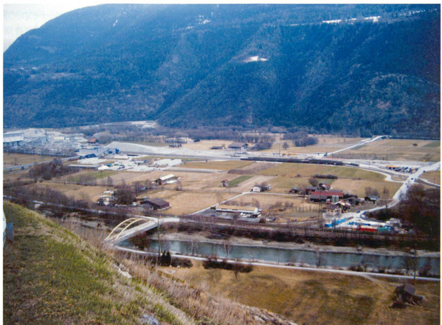
Abb. 1: Dicht genutzter Talboden im Abschnitt Visp (links) und Raron. Hier kumulieren zahlreiche Interessen und Nutzungsprobleme: 1. Neat (Ast Lötschberg) geht von rechts unten nach links oben quer durch die Ebene, 2. SBB-Linie bisher (Sion-Brig), 3. A9-Trasse (neu, dazu gehören auch Kompensationsmassnahmen), 4. diverse Zwischendepots der verschiedenen Grossprojekte (gut sichtbar links von der Mitte), 5. die Rhone: auf der Höhe der Gemeinde Balt-schieder ist eine Aufweitung vorgesehen, 6. ehemaliger Militärflugplatz Raron mit teilweiser Aufhebung und Rekultivierung und mit teilweiser Weiternutzung als Sportflugplatz, 7. Landwirtschaftsflächen.

Obwohl die landwirtschaftlichen Aspekte immer noch einen wesentlichen Anteil der Aufgaben ausmachen, sind es die Bereiche Natur- und Landschaftsschutz mit den ökologischen Vernetzungen, Raumplanung, Verkehr, Freizeit und Tourismus, Boden- und Gewässerschutz sowie eben auch die Anliegen der R3, welche heuti-