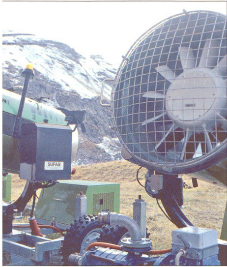
Abb. 5: Beschneigungsanlage Riffelalp (VS).

präsentative Umfragen stützen, sollen die Abstimmung von Verkehrs- und Raumplanung unterstützen.