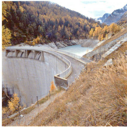
Abb. 3: Stausee Zmutt (VS).