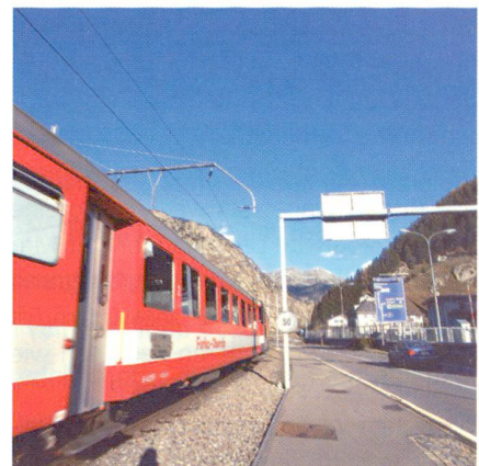
Abb. 4: Verkehrsinfrastruktur Andermatt.

Der Ausbau von Verkehrs- und Unterhaltungsinfrastrukturen steigert zwar die Attraktivität von Tourismusregionen, er bringt aber auch ökonomische, ökologische und soziale Belastungen mit sich. Das Projekt von Kay Axhausen (ETH Zürich) untersucht die Konsequenzen aus der zunehmenden Erschliessung der Landschaft für deren Nutzung. Die Ergebnisse, welche sich u.a. auf Verkehrsmodelle und re-