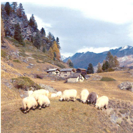
Abb. 2: Alpweide Zmutt (VS).