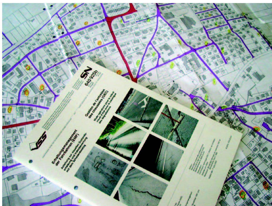
Abb. 1: Grundlagen und Normen.

erlaubt die Georeferenzierung der erfassten Daten. Punktschäden werden zusätzlich mit einem Foto und den dazugehörigen Lagekoordinaten dokumentiert. Die Grundlage zur Beurteilung des Strassenzustandes bilden in erster Linie die digitalisierten Videoaufzeichnungen. Diese werden für jede Strasse einzeln geschnitten und zur späteren Ansicht in das Ge-