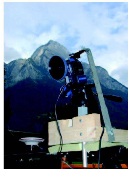
Abb. 2: Zustandserfassung mittels Video.

und kann als eigenständige Beurteilungsgrundlage herangezogen werden. Mit einer speziell dafür ausgerichteten Kameraausrüstung werden die Strassen mit 15 km/h abgefahren und auf Video aufgezeichnet. Mittels Monitor werden die Aufnahmen ständig überwacht. Die zusätzliche Positionsbestimmung mit GPS