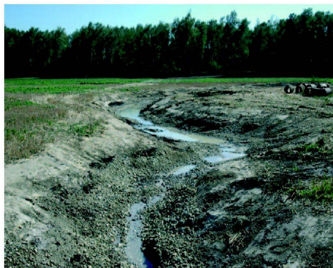
Abb. 3: Öffnung Tobelbrunnenbach.