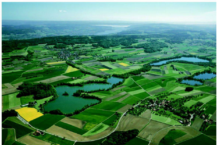
Abb. 1: Luftbild Seebachtal.

Zur ökologischen Aufwertung des Seebachtales wurden grossflächige Renaturierungen geplant. Auf Grund von Voruntersuchungen waren folgende Massnahmen vorgesehen: Schaffung von Amphibienlaichplätzen und -biotopen, Renaturierung von stiftungseigenen Parzellen, Abschürfen von humosen Böden,