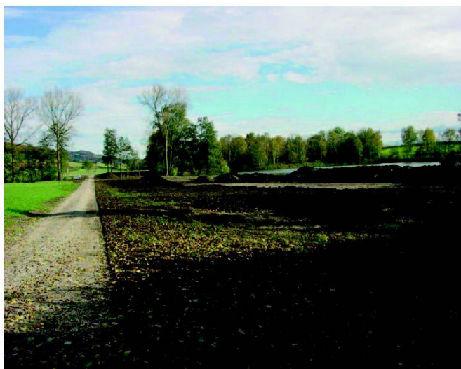
Abb. 2: Neuer Güterweg trennt Naturschutzgebiet klar von landwirtschaftlich bewirtschafteten Flächen.

Der Neuantritt im Gebiet Hüttwilersee erfolgte auf den 1. April 1998, im Gebiet Nussbaumersee am 1. April 2000. Auf Basis der Zusicherungskredite von Bund und Kanton wurden die geplanten Massnahmen seither etappenweise umgesetzt. Die Strukturverbesserungen wurden mit den Naturschutz- und Renaturierungsmassnahmen koordiniert und weitgehend umgesetzt. Die Bauleitung wurde vom kantonalen Landwirtschaftsamt, Abteilung Strukturverbesserungen, übernommen.