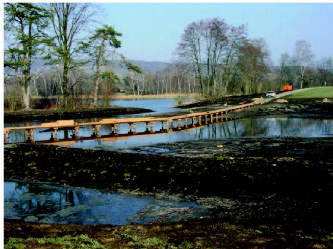
Abb. 5: Uferabflachung mit Fussgängersteg.