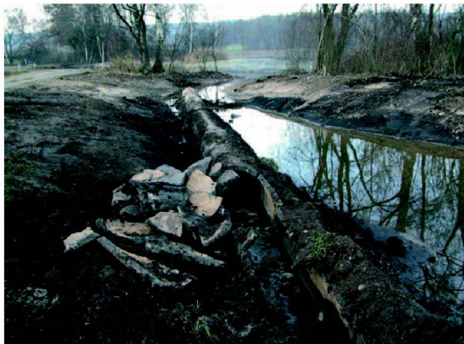
Abb. 4: Abbruch von Drainageröhren.