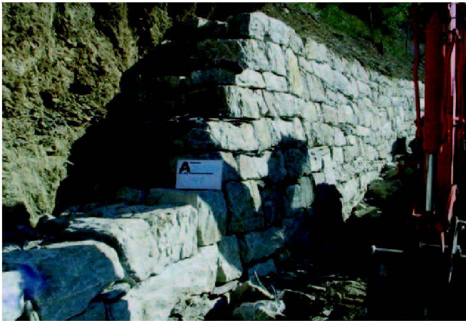
Abb. 5: Nachhaltiger Trockenmauerbau.