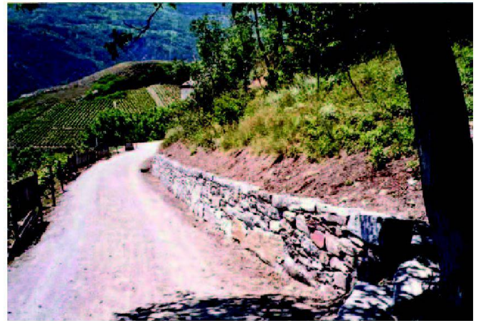
Abb. 6: Die Aufrechterhaltung der landwirtschaftlichen Erschliessungsfunktion garantiert den Bestand des Kulturweges.

Bundesbeitrag in Aussicht steht, müssen die Projekte vorgängig publiziert werden, damit sich die beschwerdelegitimierten Organisationen am kantonalen Verfahren beteiligen können. Beschwerden sind sehr selten. Das Landwirtschaftsgesetz schreibt vor, dass bei der Projektgenehmigung die Schutzbelange zu beachten und die Bundesinventare verbindlich sind. Im Rahmen des Subventionsverfahrens kann der Bund Bedingungen und Auflagen formulieren. Diese können beispielsweise im Interesse von Objekten von nationaler Bedeutung oder von schützenswerten Biotopen erlassen werden.