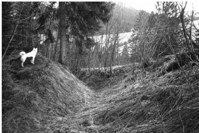
Abb. 3: Der wiedergefundene Hohlweg auf dem Alten Schwyzerweg bei Änglisfang.