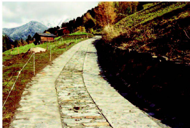
Abb. 4: Die Riedgasse am Albrunweg: eine Bicki wird wiederhergestellt.

um die Zufahrt in das wertvolle Landwirtschaftsgebiet von Hockmatte zu sichern. Aufgrund der Bekanntschaft aus der Güterzusammenlegung Binn hatte der Kanton den IVS-Leiter um seine Mitarbeit angefragt. Das daraufhin erstellte Gutachten diente als Projektierungsvorgabe. Insbesondere auf dem Steilstück der Riedgasse galt es eine technische Nuss zu knacken. Die Landwirte hatten bereits behelfsmässig mit überschüssigem Beton die dortige Pflästerung überdeckt. Infolge der Steilheit wurden Beton und Pflästerung durch die Beanspruchung mit den Transportfahrzeugen immer mehr aufgelockert. Die ursprüngliche «Bicki» wurde nachgebaut, indem die Pflästerung in den Fahrspuren in Beton eingelegt und der Mittelstreifen mit Quersteinen wie früher verpflästert wurde.