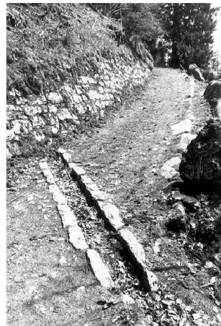
Abb. 1: Gemeinde Brienzwiler, vom Bund subventionierter Alpweg Wylervorsass, 2500 m lang, Ausführungskosten Fr. 18 200.-, ausgeführt 1896; heute historisches Objekt von nationaler Bedeutung (BE 162) wegen seiner überdurchschnittlichen Substanz.

gestellt, die zu einer augenfälligen Hierarchisierung der Verkehrsnetze führten. Der Motorfahrzeugverkehr verlangte befestigte und breitere Strassen, auf denen für Wanderer und Landwirtschaftsverkehr kein Platz mehr vorhanden war. Mit Einsetzen der Mechanisierung in der Landwirtschaft wurden auch von der Bewirtschaftung her neue Anforderungen gestellt. Traktorenzüge brauchten befestigte Wege. Für die häufig benutzten Hofzufahrten wurde ein Standard mit Belag erwartet, wie er in überbauten Gebieten üblich ist. Aus technischer, landschaftlicher und funktioneller Sicht war es oft sinnvoll, die vorhandene Wegführung beizubehalten. Mit dieser Entwicklung begannen sich die Konflikte auch im Landwirtschaftsgebiet zu häufen, vorerst aus Unwissenheit und unbemerkt. Ab Mitte der 80er Jahre, mit der Aufnahme der Arbeiten am IVS, setzte dann die Sensibilisierung für die schützenswerten historischen Wege ein und damit die Erkenntnis, dass der mit einem alten Weg verbundene Bezug zu unserer Herkunft auch einen Wert aufweist, den es zu er-