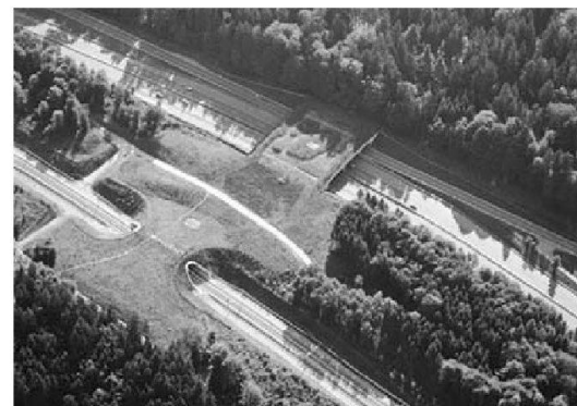
Abb. 1: Ökobrücken lindern die negativen Effekte der Zerschneidung der Landschaft durch Verkehrsbauten, hier A1 und Bahn 2000.

Der Bund will die Nachhaltigkeit von Verkehrsvorhaben in Zukunft systematisch und auf mehreren Ebenen beurteilen. Für die Beurteilung der Agglomerationsprogramme Verkehr + Siedlung hat der Bund ein Handbuch entwickelt. Auch der Programmteil des Sachplans Verkehr orientiert sich an den Nachhaltigkeitskriterien. Das Bundesamt für Strassen wird in Zukunft die Nachhaltigkeit von Strassenverkehrsprojekten systematisch überprüfen.