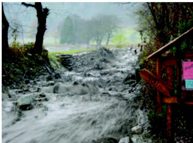
Abb. 3: Die Strasse als Bachbett am Samstagnachmittag, 16. November 2002 um 16 Uhr.