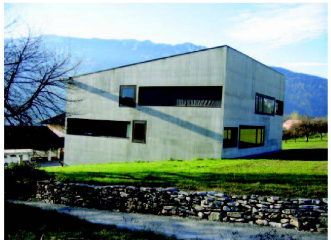
Abb. 10: Alte und neue Bautechnik in harmonischem Gegensatz: Trockenmauer nach Bauvollendung mit dem Oberstufenschulhaus, das wöchentlich von Architekten besucht wird.

samthaft entstand über Jahrhunderte eine anthropogene Kulturlandschaft von hohem landwirtschaftlichem, landschaftlich und ökologischem Wert, wie sie in den Alpentälern typisch ist, deren spezielle Konstellation einmalig und daher erhaltenswert ist.