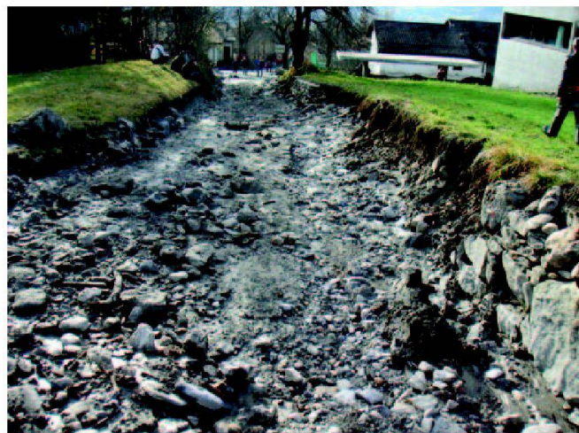
Abb. 4: Gleicher Strassenabschnitt wie in Abb. 3 von oben, am Tage nach dem Unwetter. Rechts ist der Rest der Trockenmauer sichtbar (grosser Findling im Mauerfuss).