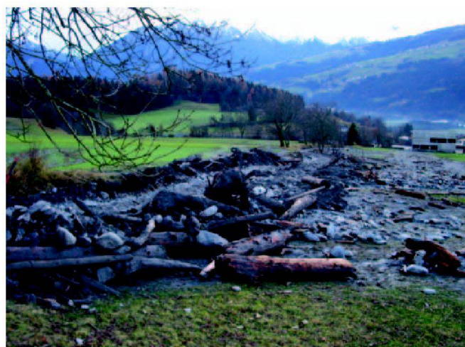
Abb. 6: Der Schuttfächer wurde mit Holz und Geröll übersart und hätte beinahe das Schulhaus (rechts im Bild) in Mitleidenschaft gezogen.

sten. Die Gemeinden waren angehalten, Fachleute als Bauleiter einzusetzen, die zusammen mit den Amtsstellen die Projekte und Bauprogramme durchführten.