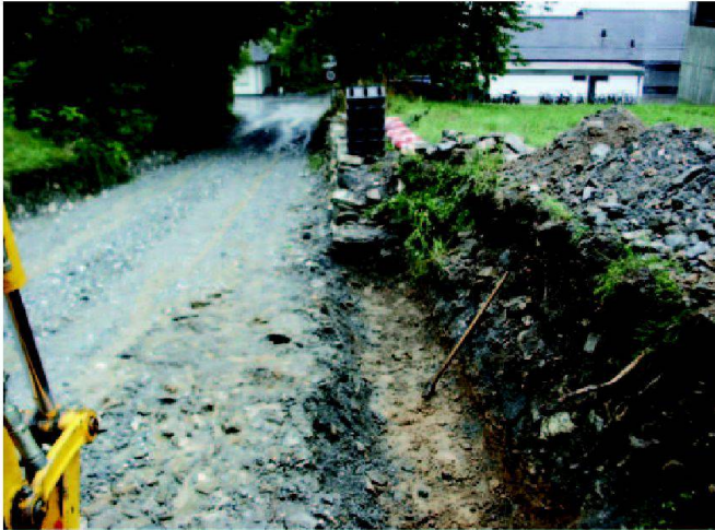
Abb. 7: Aushub des Fundaments für die Trockenmauer.