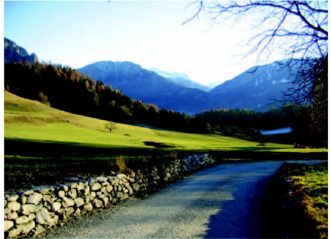
Abb. 8: Instand gestellte Trockenmauer am Kegelhals.