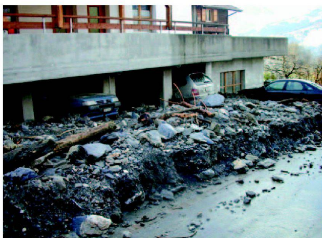
Abb. 5: Im Dorf wurden Gebäude massiv beschädigt durch den Murgang.