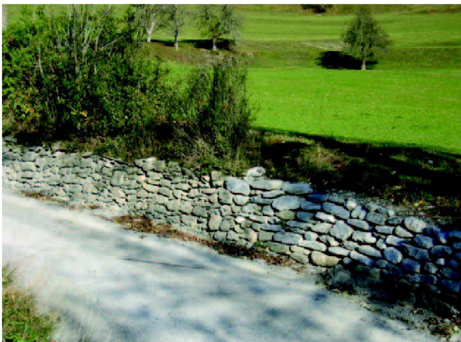
Abb. 9: Erneuerter Mauerabschnitt, der lokal eingepasst wurde und der genügend lang war, um den fehlenden Anzug zu konstruieren.